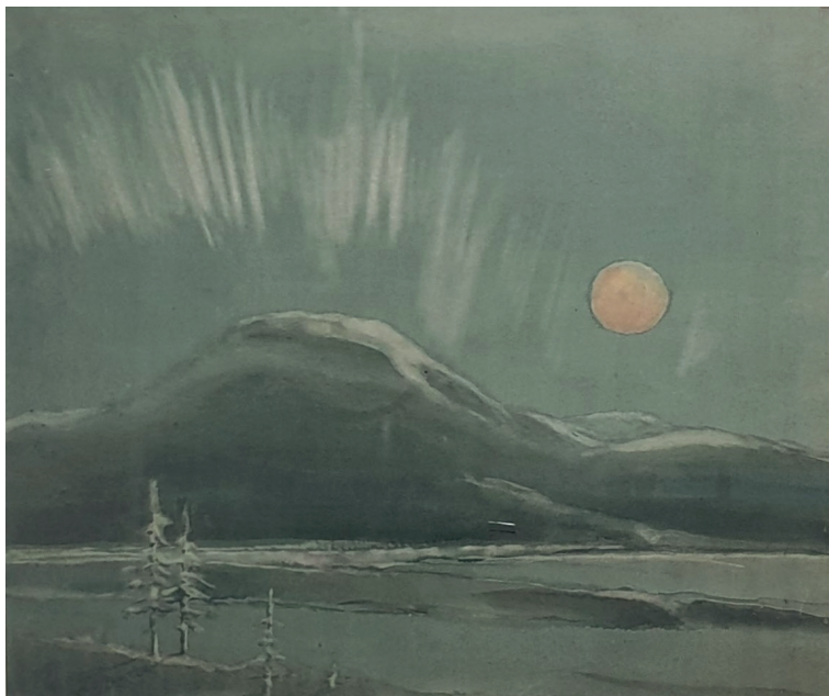
4. attēls. Herberts Mangolds. Polārā nakts. 20. gs. 60. gadi. Papīrs, akvarelis. Latvijas Okupācijas muzejs, OMF 6518/6

Figure 4. Herberts Mangolds. Polar night. 1960s. Paper, watercolor. Museum of the Occupation of Latvia, OMF 6518/6