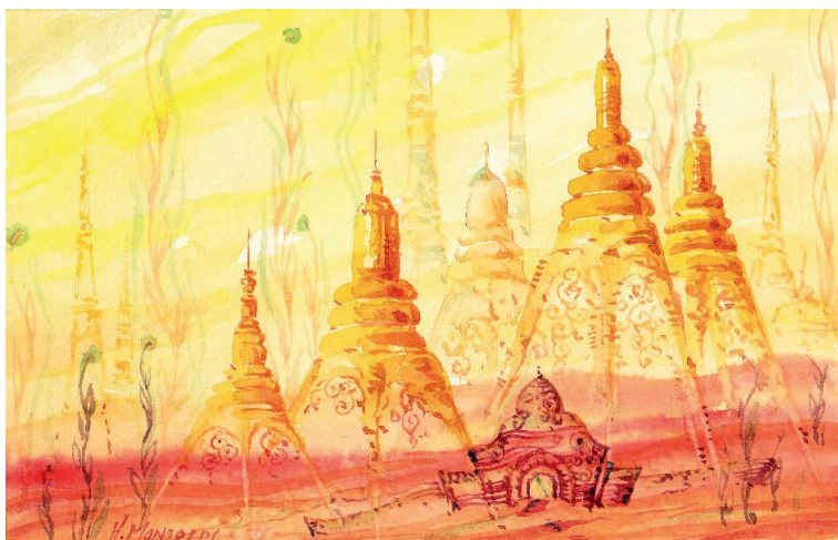
5. attēls. Herberts Mangolds. Austrumu motīvs. 20. gs. 70. gadi. Papīrs, akvarelis. 10 × 15,5 cm. Klasiskās mākslas galerija “Antonija”

Figure 4. Herberts Mangolds. Polar night. 1960s. Paper, watercolor. Museum of the Occupation of Latvia, OMF 6518/6