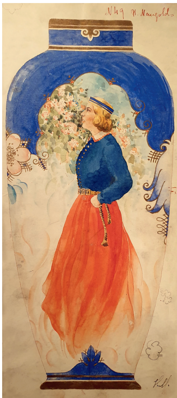
3. attēls. Herberts Mangolds. Skice dekoratīvai vāzei ar tautumeitu. 20. gs. 30. gadi. Papīrs, akvarelis, bronza. 15 × 33,5 cm. Dekoratīvās mākslas un dizaina muzejs, DLM/K 4919

Figure 3. Herberts Mangolds. Sketch for a decorative vase. 1930s. Paper, watercolor, bronze. 15 × 33.5 cm. Museum of Decorative Arts and Design, DLM/K 4919