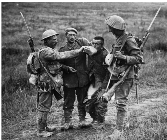
5 Britu karavīri piedāvā ūdeni vācu karagūsteknim, 1917.

Tiesa, šāda atbildības izpratne var šķist biedējoša. Ja individuālais Es ir tas, kas ar savu personīgo rīcību un ētiskajām izpratnēm liek pamatu atvērtākai saziņai ar Citu un, iespējams, sabiedrībai, tad tam vajadzētu būt apliecinājumam, ka citi arī spēj izjust šādu pienākumu un rīkoties atbilstoši. Apzinoties ārējo faktoru un individuālo aizspriedumu, patiesību un zināmo divējādo ietekmi manas patības veidošanā, man ir nevis jārikojas vienam, bet