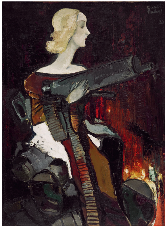
1 “Madonna ar ložmetēju”. Kārlis Padegs, 1932. Latvijas Nacionālais mākslas muzejs