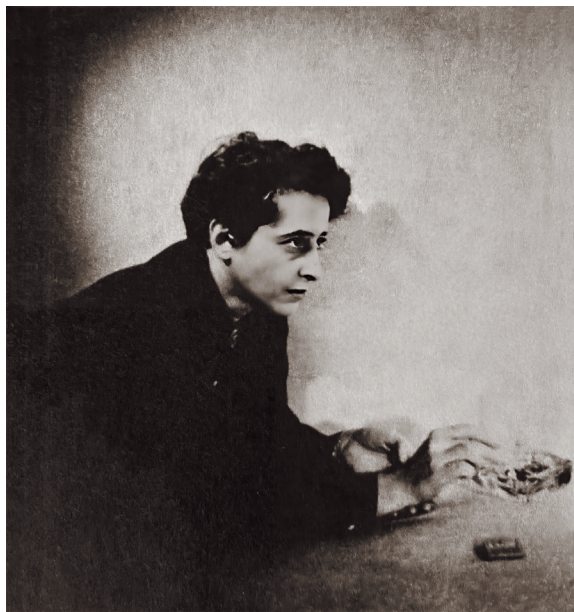
1 Hanna Ārente, 1944. gads.

Piedzimšana, pirmkārt, ir eksistenciāla kategorija, caur to cilvēks faktiski parādās noteiktā telpā (uz zemes un cilvēku lietu pasaulē) un laikā. Otrkārt, piedzimšanas fenomenam ir dziļāka, transcendentāla nozīme, proti, cilvēkam piedzimšana ir tas iedzimtais spēks, kurā